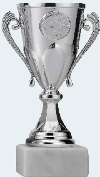
Je hebt een geweldige prestatie geleverd, die is wel een prijsbeker waard!

"Bij mensen met een licht verstandelijke beperking heb je de neiging om te veel te praten," vertelt Mieke. "Ze praten zelf vaak ook op een logische manier. Je wilt hen niet kinderachtig behandelen. Toch ben je te talig en dat leidt tot conflicten. Je drijft de cliënt in het nauw met je taal, je over-