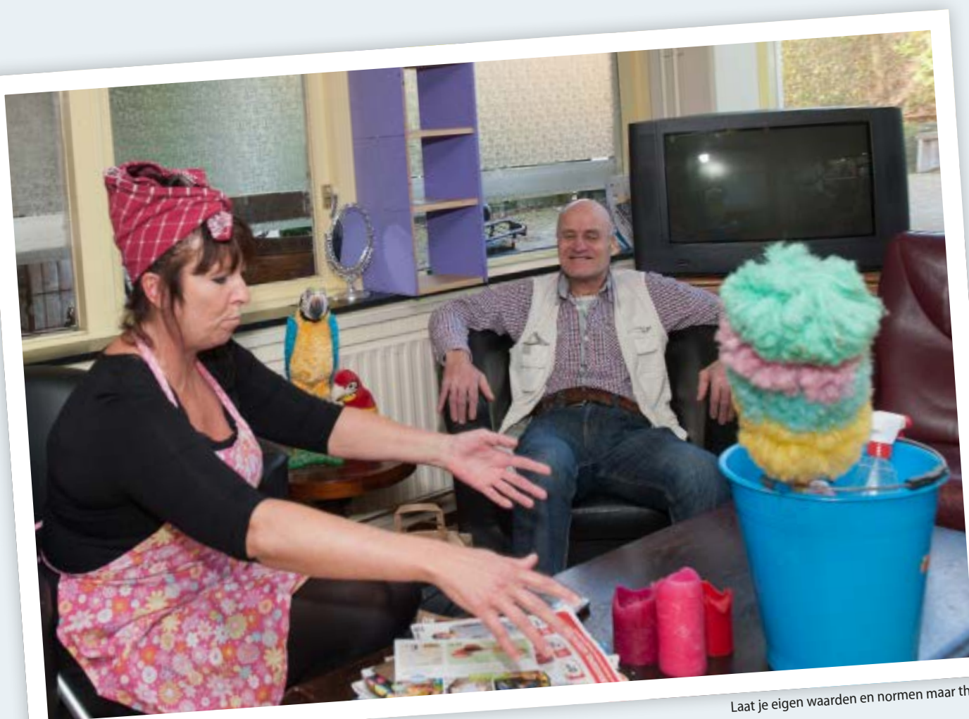
Laat je eigen waarden en normen maar thuis

Omgekeerd komt ook voor: dat je mensen onderschat omdat ze niet goed kunnen praten. Ga na wat de diagnostiek over jouw cliënt zegt. Is zijn profiel harmonisch, of disharmonisch? De kloof tussen intelligentie en emotioneel ontwikkelingsniveau is vaak behoorlijk groot. Kennis over iemands ontwikkelingsleeftijd helpt je om beter te begrijpen wat hij echt bedoelt als hij zegt 'Ik ga het doen.' Dan weet je ook dat je niet boos of teleurgesteld moet zijn als hij het vervolgens niet doet."